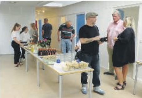
Tirsdag sidste uge var der dækket op til indvielse i den tidligere Lynæs Børnehavn, som nu huser ca. 50 skolebørn plus lærere og pædagoger.