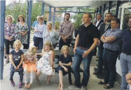
Skolen Ved Havet starter op med undervisning for elever i 0.-7. klasse og om et par år udvides op til 9. klasse.

af dem havde første dag i den helt nye Skolen Ved Havet, der er startet op på privat initiativ efter "adskillige bump på vejen".